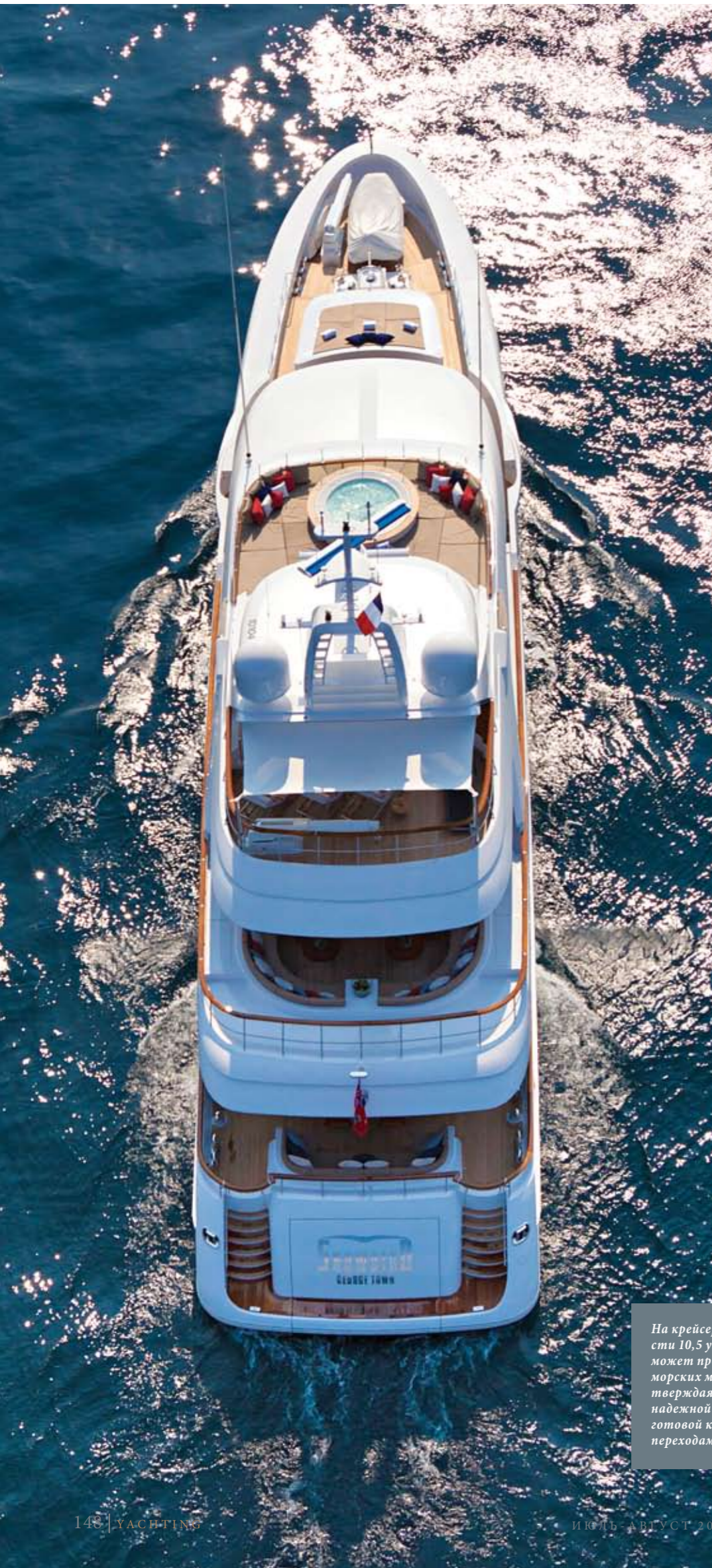
На крейсерской скорости 10,5 узла Snowbird может пройти до 3800 морских миль, подтверждая репутацию надежной суперяхты, готовой к океанским переходам